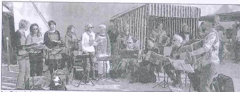
Les Potes Agés ont largement participé à l'animation de la fête.

Ce dimanche, au chef-lieu pour la traditionnelle Fête paysanne, les visiteurs se sont déplacés en nombre réchauffés par un beau soleil.