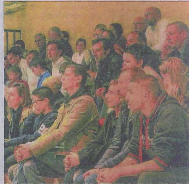
Le public attendait les solutions proposées.

Un appel est lancé pour rejoindre le club sur les terrains, encourager les équipes, et aider sur les événements tout au long de l'année, arbitrer ou tenir une table de marque et intégrer l'équipe sponsoring,