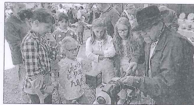
Les enfants passionnés par le travail du bois.

Deux tombolas et deux animations musicales diver-