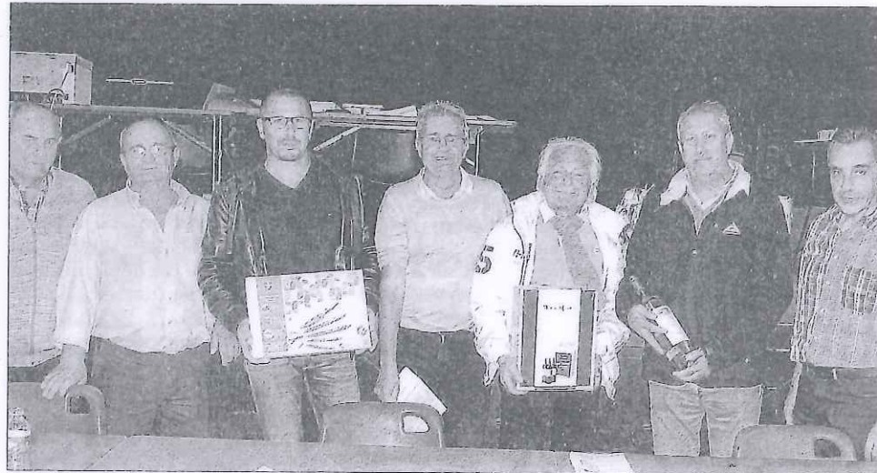
Les vainqueurs entourés de l'équipe dirigeante et de l'arbitre. Lors de cette soirée particulière qui restera gravée dans les mémoires, tous les joueurs sont à féliciter pour leur excellent état d'esprit. Des remerciements ont été faits aux nombreux bénévoles qui ont œuvré sans compter pour que l'organisation soit parfaite.