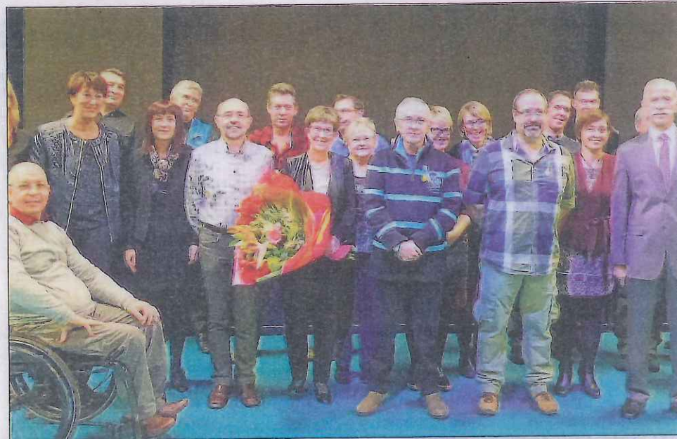
Les quatre récipiendaires de la journée, bien entourés. Le verre de l'amitié et le repas offert par la mairie suivaient cette mise à l'honneur dans la meilleure convivialité qui soit.