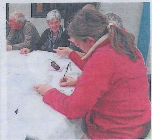
Questionnaire, explications du et avec le maire, échanges et débriefing ont été les grandes étapes de ce premier atelier.